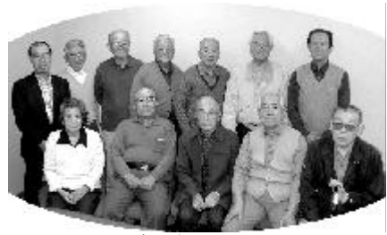
高津シルバーガイドの会のみなさん

場所：高津区二子 1 / 東急二子新地駅下車 多摩川の川沿いであって季節の移り変わりも味わえる。日本一の文学碑ともいわれている