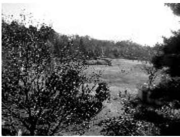
6 王禅寺ふるさと公園